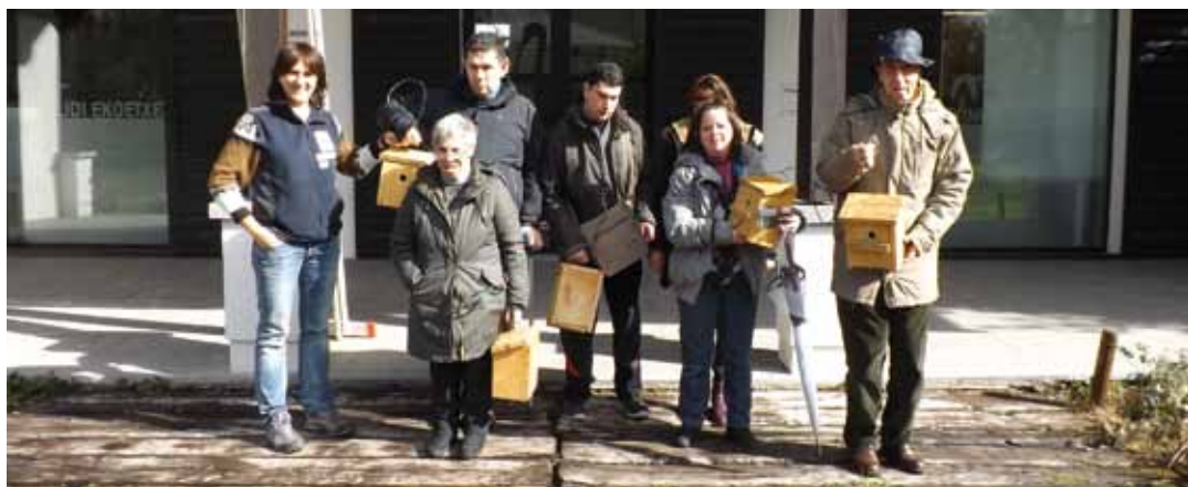
Usuarios del centro Garagune de Irun (Fundación Goyeneche) posan con las cajas nido antes de su colocación

5 de las 15 cajas nido colocadas en el Parque Ecológico de Plaiaundi fueron bautizadas y colocadas por usuarios del Centro Garagune de Irun (Fundación Goyeneche) , quienes previamente “bautizaron” y registraron estas cajas. Esta primavera deberán realizar el seguimiento de estas cajas-nido para conocer la ocupación de las mismas y en otoño se procederá a su limpieza.