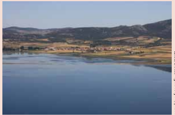
Detalle de la Laguna de Gallocanta

"La ruta cultural de las grullas" fue la idea sobre la que se creó GRUS , un proyecto de cooperación transnacional entre zonas rurales de Europa, desde Suecia, Alemania, Francia y España, con la presencia de las grullas como elemento común. El objetivo, una vez más, era retroalimentar los valores de la cultura tradicional con los de la naturaleza protegida y tratar de encontrar entre ambos un futuro posible. Aunque no siempre se han consensuado las acciones y las estrategias para ello, sigue siendo la referencia para muchas personas y para algunas instituciones.