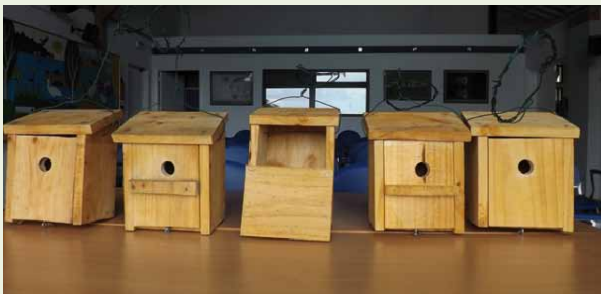
Cajas nido preparadas para ser colocadas

para que las vuelvan a ocupar las cajas deben de estar vacías y libres de excrementos. Además de las cajas nido convencionales se prevé colocar una caja nido con un equipo de cámara para emitir imágenes de su interior desde las pantallas del centro Txingudi Ekoetxea. Dentro de este proyecto se prevé también la colocación de varios comederos.