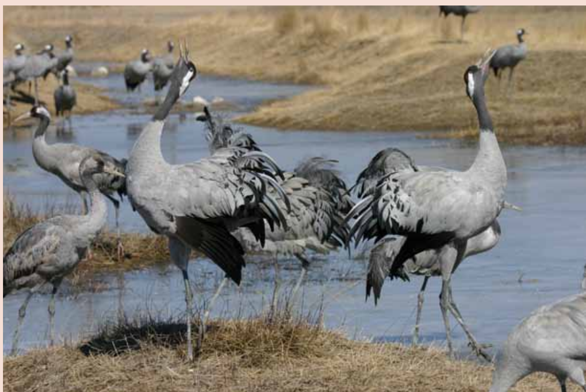
Grupo de grullas en la Laguna de Gallocanta

Por supuesto, ese conflicto generó también actitudes beligerantes de la población local a todo lo que significase grullas. Esta también fue una de las razones de fundar la Asociación Amigos de Gallocanta y de crear en el año 1999 el Festival de las Grullas . Se trata de un evento de fin de semana en donde se unen las actividades naturalistas con otras de cultura tradicional, realizando "El Día de Bienvenida" en el primer fin de semana de noviembre y "El Viaje de Vuelta" en el primer fin de semana de febrero. El objetivo era crear un momento y un espacio en el que se dieran cita los visitantes amantes de las aves y la naturaleza con la población local. Además, se realizaron campañas de sensibilización con escolares y montón de otras actividades como