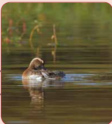
argazkia • fotografía ARCHIVO PLAIAUNDI

Uda-zertzeta Cerceta carretona Anas querquedula