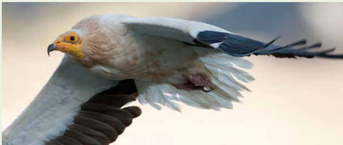
Weban holako argazki ikusgarriak ikus ditzakezu

! Natura-argazkiak partekatu ahal izango dugu