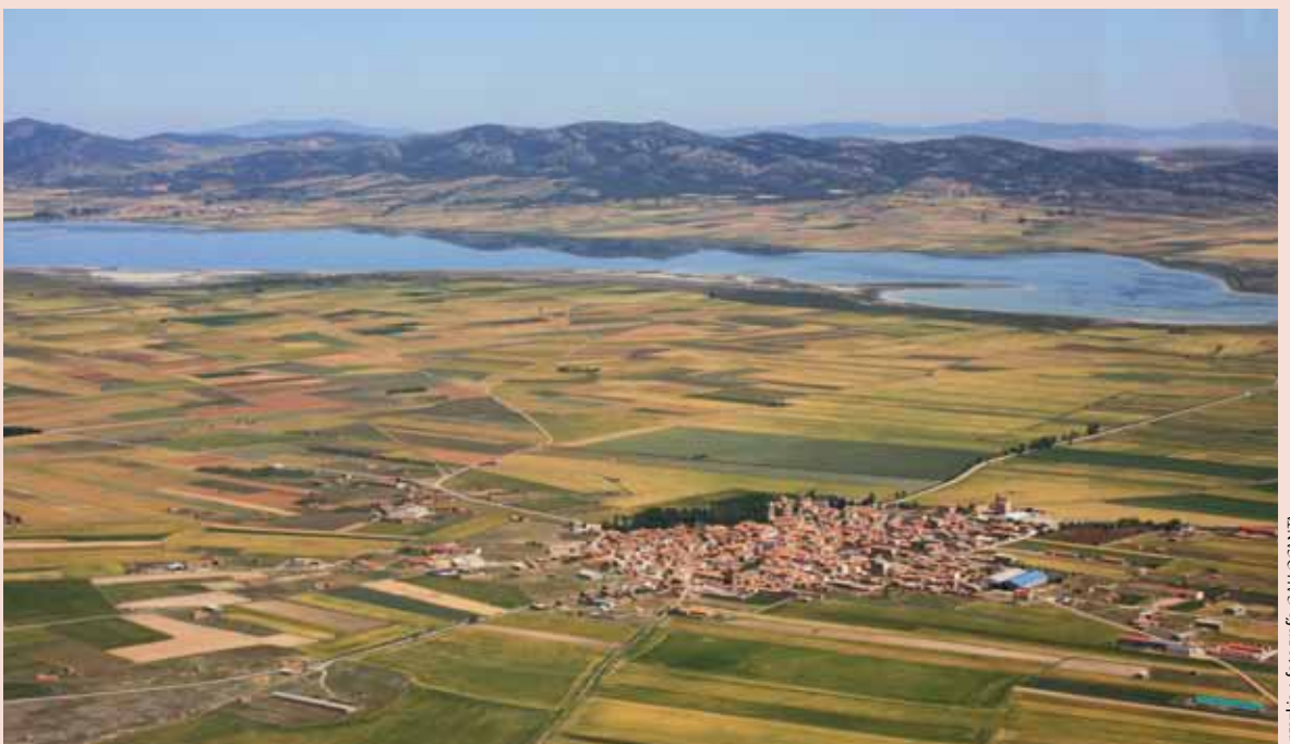
Vista aérea de la Laguna de Gallocanta

Por su puesto, elegir la época del año en función de tus intereses naturalistas. Para ver grullas, puedes ir desde finales de octubre hasta primeros de marzo y los pasos migratorios de primavera son muy interesantes. Y una vez allí, los mejores momentos para observar las grullas son el amanecer y el atardecer, que es cuando, normalmente realizan la salida y la entrada a la laguna en grandes bandos en forma de V.