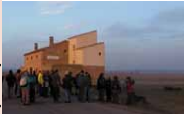
Centro de Interpretación Laguna de Gallocanta