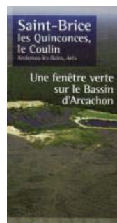
Conservatoire du littoral