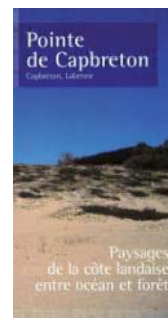
Conservatoire du littoral

La série de dépliants sur les sites aquitains du Conservatoire a débuté avec Saint-Brice , suivi de la Pointe de Capbreton . Ces dépliants grands publics, sont également conçus pour une meilleure visibilité du Conservatoire sur ses terrains. Sont en préparation, le Marais d'Orx et le Domaine d'Abbadia-Corniche basque.